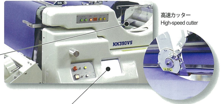
高速カッター High-speed cutter